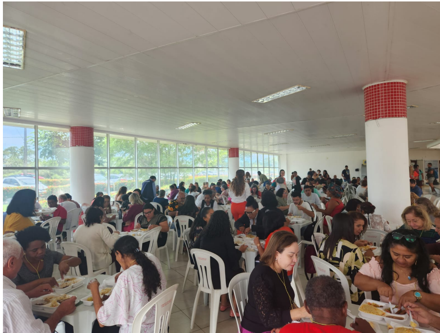
Almoço do dia 29 de março de 2023