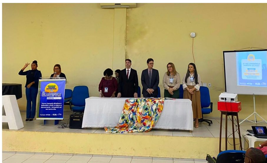
Pré-Conferência Distrito Tirirical