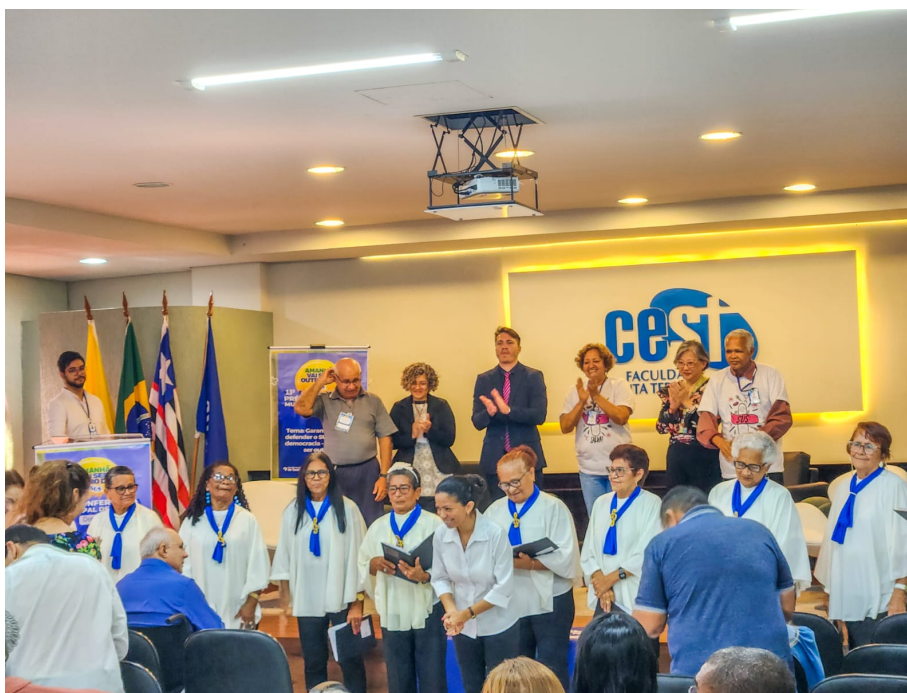
Pré-Conferência Distrito COHAB/COROADINHO