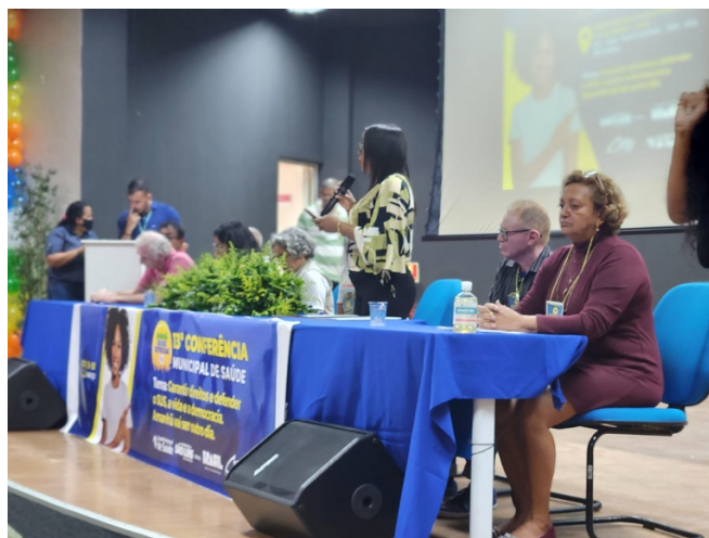
Mesa de usuários e trabalhadores do SUS

Na sequência, foi composta uma mesa por representantes dos usuários e trabalhadores, sendo realizada projetada para a plenária, um diagnóstico situacional dos serviços de saúde da capital, com proposituras de melhoria.