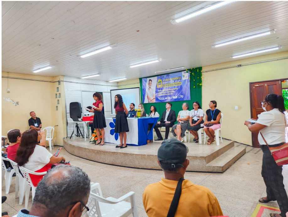
Pré-Conferência Distrito Itaqui-Bacanga