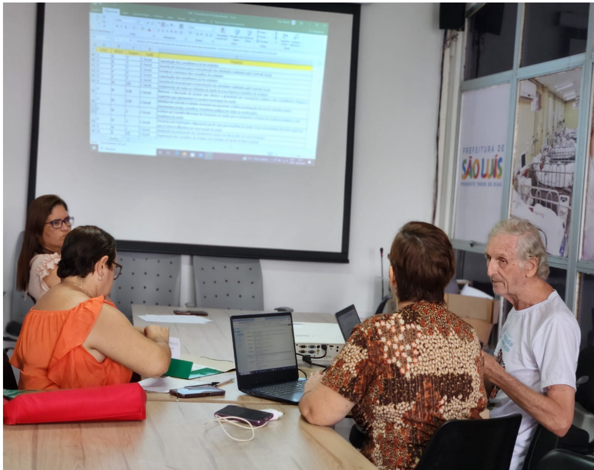
Comissão de Conteúdo e Metodologia Sistematizando as Propostas das Pré-Conferências de Saúde