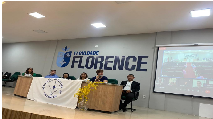
Pré-Conferência Livre Associação Brasileira da Enfermagem - Aben