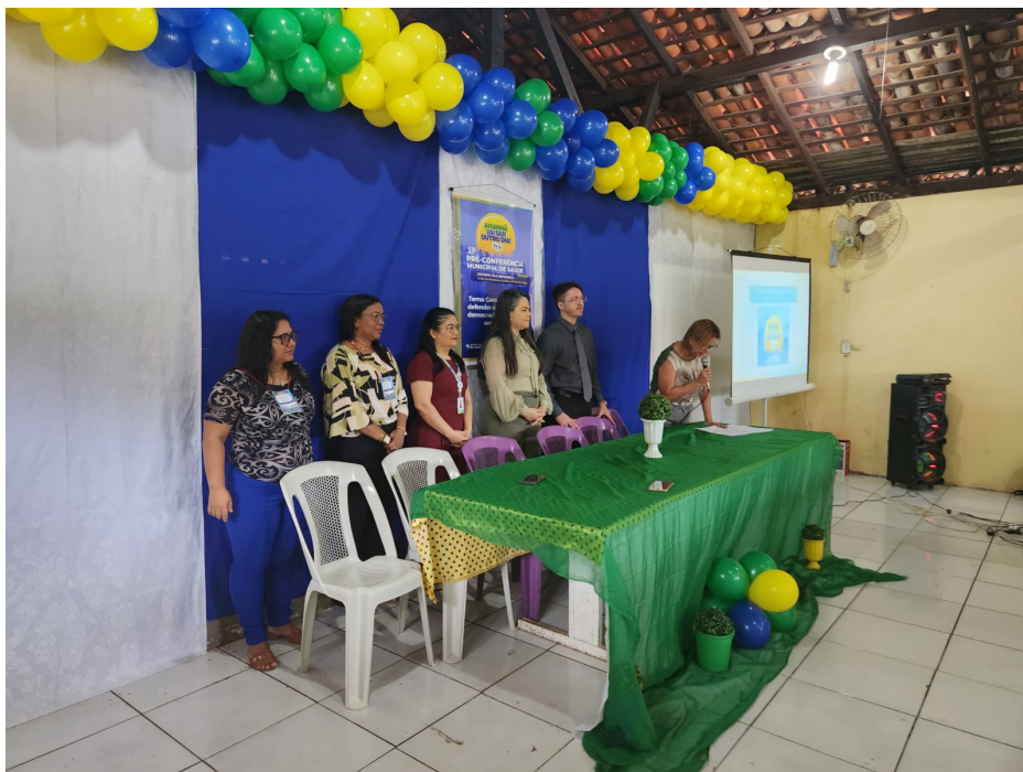
Pré-Conferência Distrito Vila Esperança