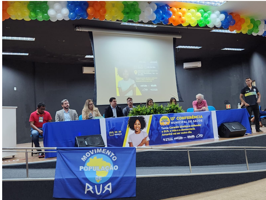
Mesa de Abertura da 13ª Conferência Municipal de Saúde de São Luís - MA

Saúde, Poder Judiciário, Ministério Público, Defensoria Pública, Fórum de Usuários do SUS, Secretaria Municipal de Saúde, Membro do Seguimento de Trabalhadores e do Conselho Municipal de Saúde.