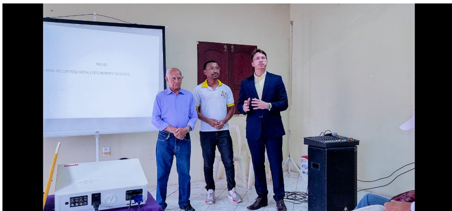
Pré-Conferência Livre da Associação Comunitária do João de Deus