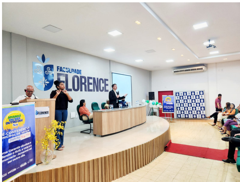
Pré-Conferência Distrito Centro

Em São Luís - MA, especialmente, foram realizadas Pré-Conferências (Distritais e Livres), antes da Conferência Municipal de Saúde, de forma a capilarizar os debates mais próximo da comunidade, elegendo delegados e discutindo propostas para serem deliberadas na 13ª Conferência Municipal.